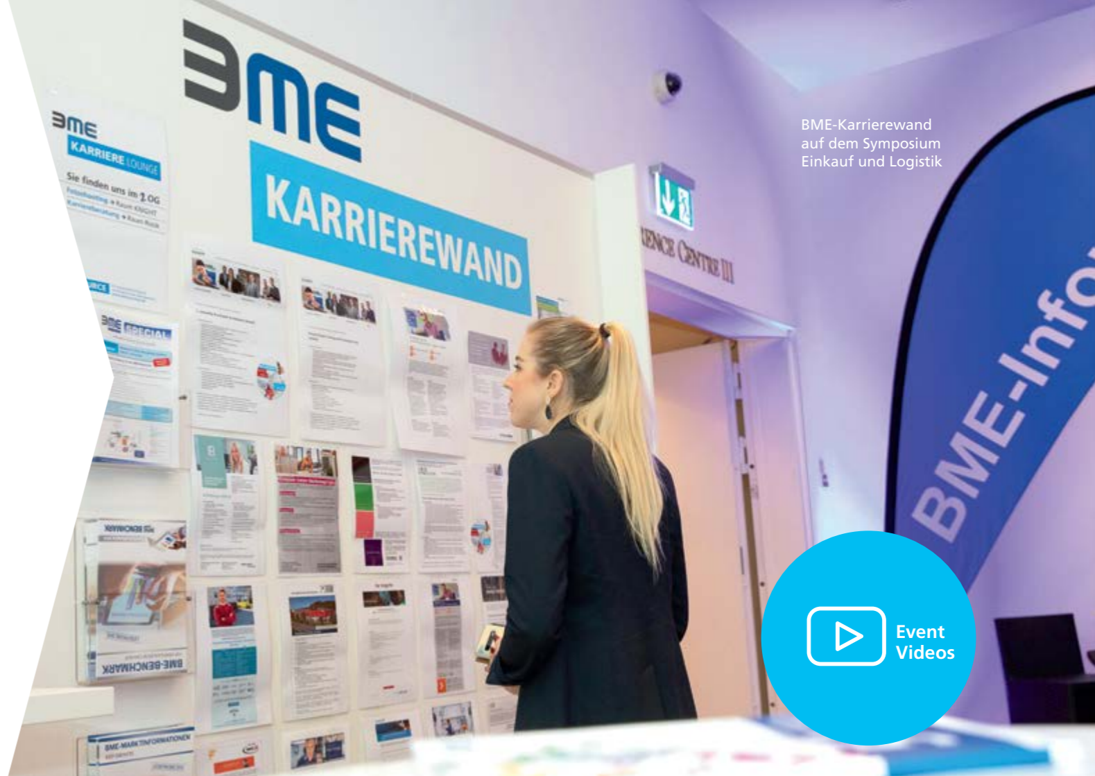
BME-Karrierewand auf dem Symposium Einkauf und Logistik